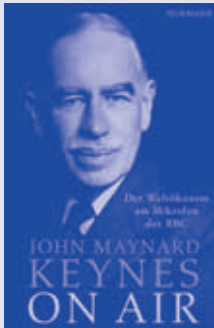
■ John Maynard Keynes, On Air. Der Weltökonom am Mikrophon der BBC, Murmann Verlag, Hamburg 2008, 240 Seiten.

Die derzeitige Finanz- und Wirtschaftskrise wird häufig mit der Weltwirtschaftskrise der frühen 1930er Jahre verglichen. Deswegen ist es nicht verwunderlich, dass dem bekanntesten Ökonomen der Großen Depression auch wieder mehr Aufmerksamkeit gewidmet wird: John Maynard Keynes . Warum „der Weltökonom“ und seine Theorien auch nach mehr als 70 Jahren derart gefragt sind, zeigt ein aktuelles Buch des Murmann Verlages, welches 19 Rundfunkansprachen und Interviews von Keynes erstmals bündelt und in deutscher Übersetzung abdruckt. Die zwischen 1927 und 1945 mit einer Ausnahme bei der BBC gesendeten Beiträge bieten einen guten Einblick in Keynes ‘ ökonomisches Denken und dessen Entwicklungsprozess im Laufe der Zeit.