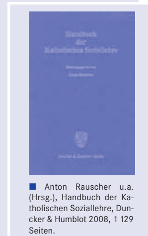
■ Anton Rauscher u.a. (Hrsg.), Handbuch der Katholischen Soziallehre, Duncker & Humblot 2008, 1 129 Seiten.

In allen Beiträgen wird trotz der differenzierten Darstellungen klar, dass die christliche Botschaft existenzielle und soziale Bedeutung hat. ■