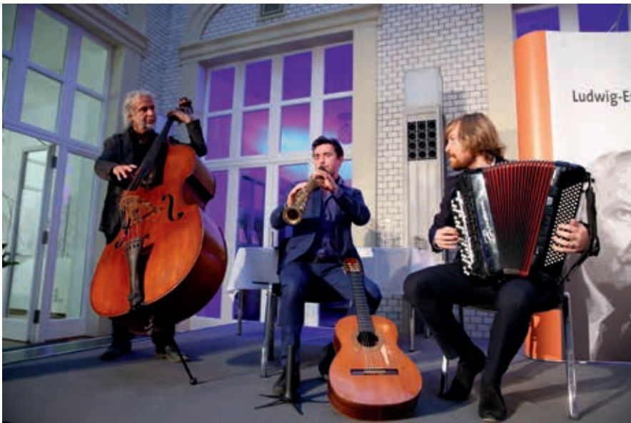
Musikalische Untermalung durch das Trio Laccasax